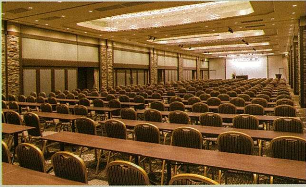
コンベンションホール天祥(イメージ)

ペットボトルまたはセルフコーヒー・室料 お1人様 1,320円 (税込) プロジェクター 1台 22,000円 (税込) コーヒーまたは紅茶・室料 お1人様 1,650円 (税込) スクリーン 1台 22,000円 (税込)